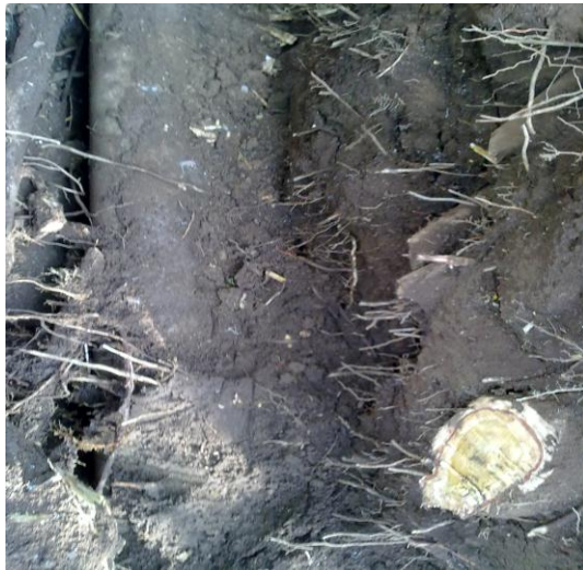
Figura 4. Tala de Árboles.