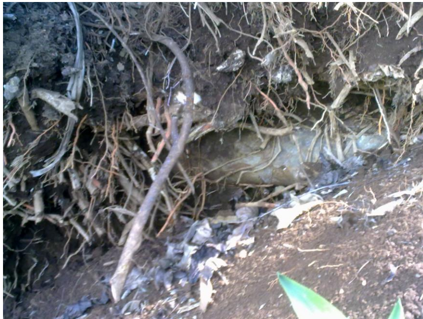
Figura 6. Tubería fue provocado por la tala de unos árboles de Guachipelín.