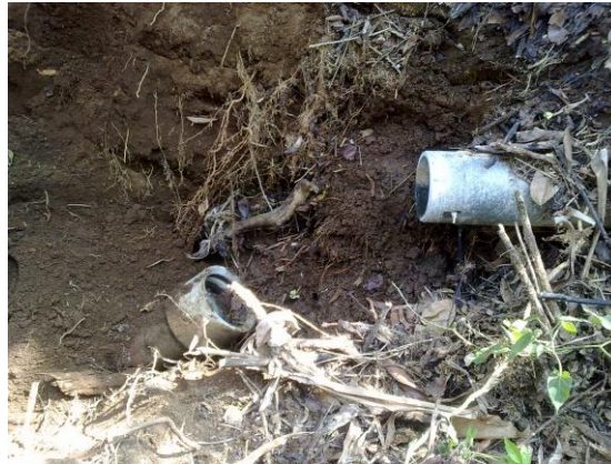
Figura 1. Fractura de línea de Conducción entre la Naciente de Candelaria y Tanque de Almacenamiento