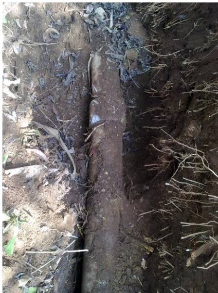
Figura 2. Tala de Árboles.