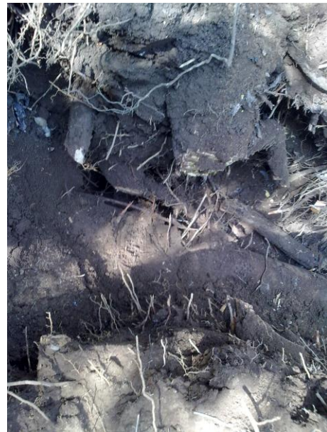
Figura 3. Tala de Árboles.