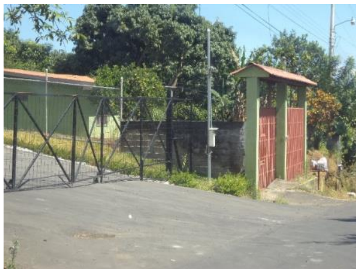
Figura 3: Derecho de vía invadido en Calle Real Dulce Nombre de Naranjo.