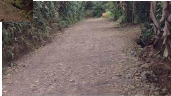
Calle Los Patios – Candelario: