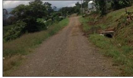
Calle Las Hortensias – San Rafael: