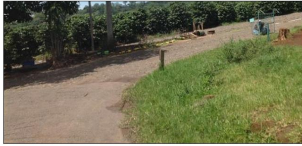
Calle Hornos – Rosario: