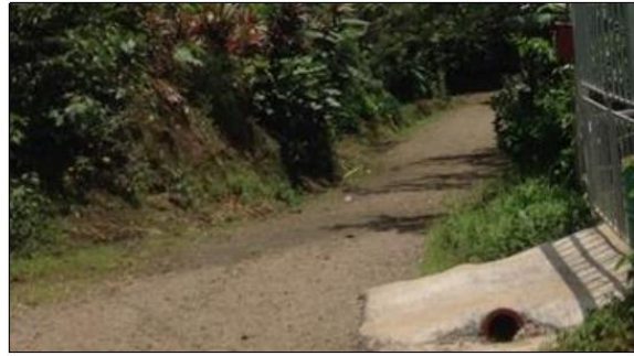
Calle Batea – Cirri Sur: