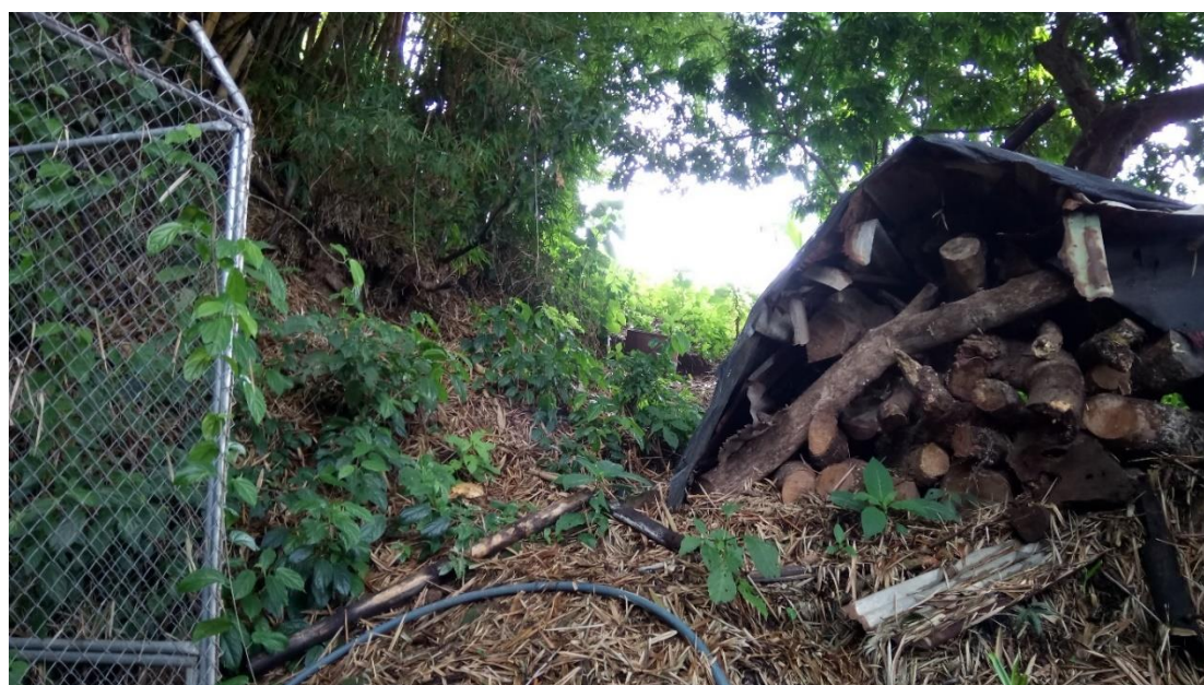
IMAGEN N° 4 NACIENTE DE SAN RAFAEL 1