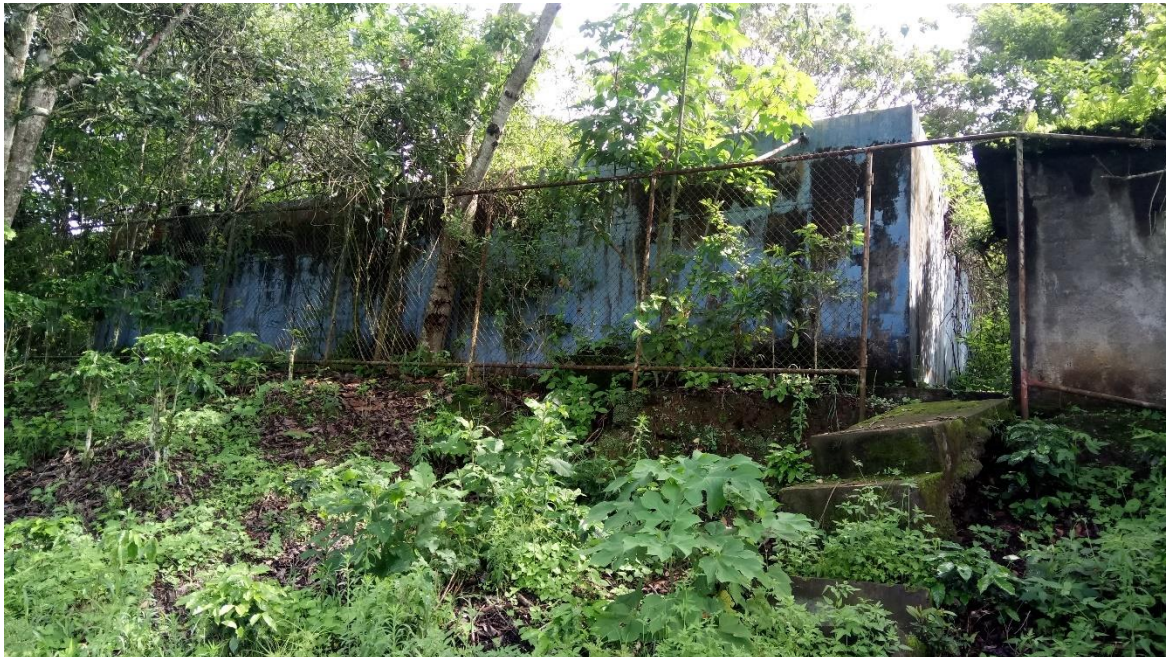
IMAGEN N° 1 TANQUE EN ABANDONO