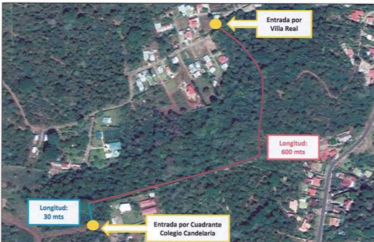
Imagen 1. Ubicación del Camino a declarar Calle Pública.